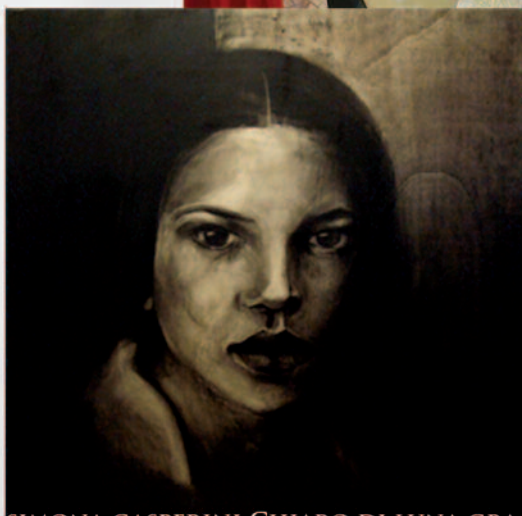
SIMONA GASPERINI CHIARO DI LUNA, GRAFITE SU TAVOLA

L'ARTE PUÒ GENERARSI IN TANTI MODI. A VOLTE NASCE DALLA SPINTA VITALE DELLE EMOZIONI. ANCHE LE PIÙ INASPETTATE. LE OPERE ESPOSTE IN QUESTA MOSTRA CONTENGONO MOMENTI INTENSI E NASCOSTI,