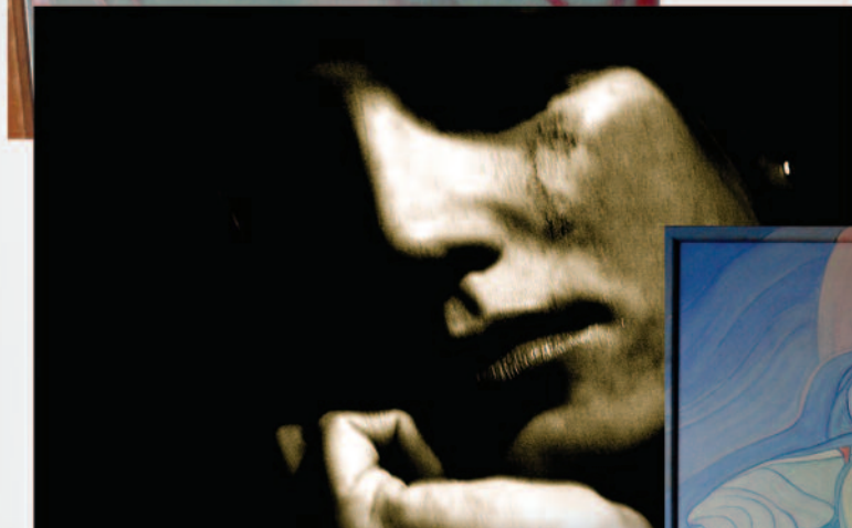
SERENA BAROTTI, ATTESA, FOTOGRAFIA SU FOREX