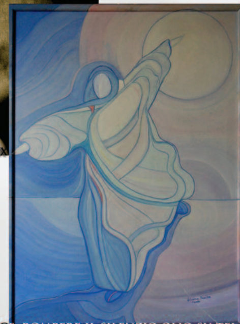
ORIANA CROCE, ROMPERE IL SILENZIO, OLIO SU TELA